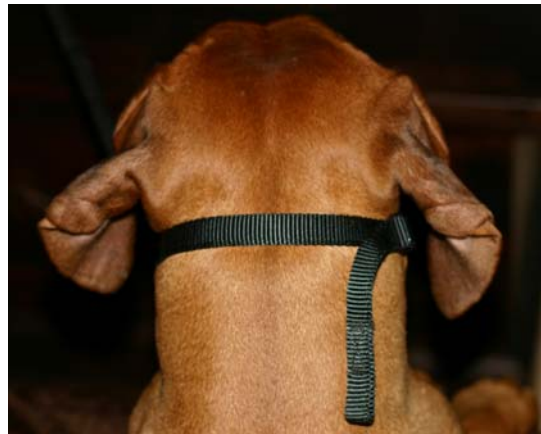
Correcte bevestiging Gentle Leader

Een Halti is vergelijkbaar met de Gentle Leader!