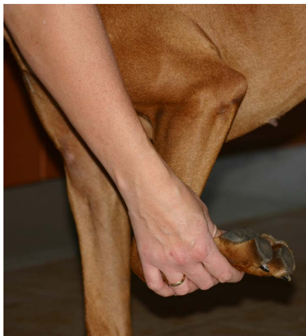
Poot achterwaarts langs het lichaam optillen

Wees altijd voorzichtig denk er bijv. aan dat een pup met tandjes kijken aan het wisselen is en zijn bekje dus heel gevoelig is. Oefen daarom bijv. alleen om voorzichtig een lipje op te tillen en hem bijv. onder kin te krabbelen. Als je te hard doet of de pup pijn doet zal hij zich later als hij ouder is niet makkelijk laten onderzoeken (bijv. bij de dierenarts, keurmeester)!