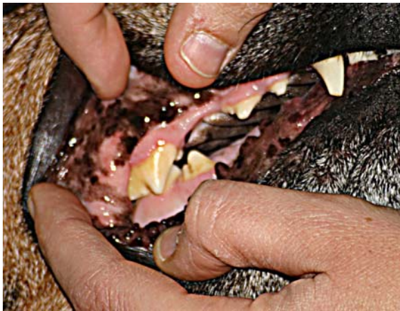
Tanden met tandplak

Kluiven op een groot bot bijv. kalfspoot kan ook tandsteen verwijderen, deze kun je gewoon in de dierenwinkel kopen.