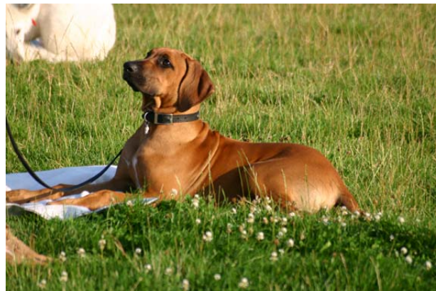
Aandacht voor de baas, de basis om iets te leren.

Ook het tegenovergestelde, met een hele energieke hond zal de aandacht niet optimaal dan is het verstandig om eerst even wat te spelen zodat de ergste "gekke" eruit is!